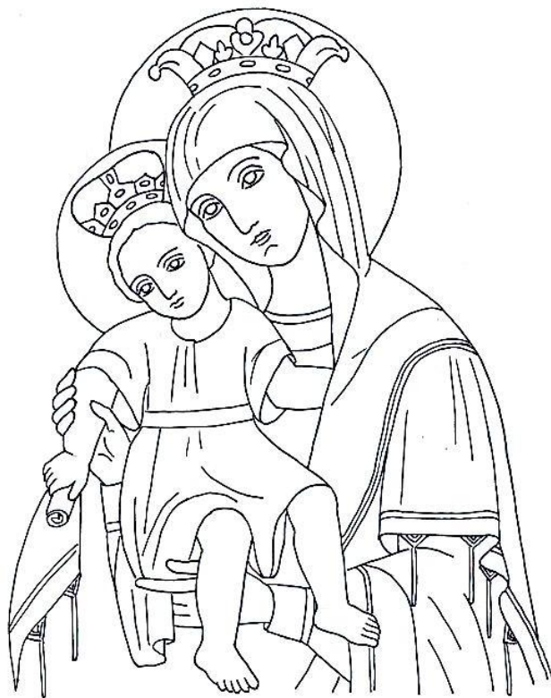
Света Богородица с Младенеца Иисус Христос

В град Витлеем в пещера на пастири, света Богородица родила Божия Син.