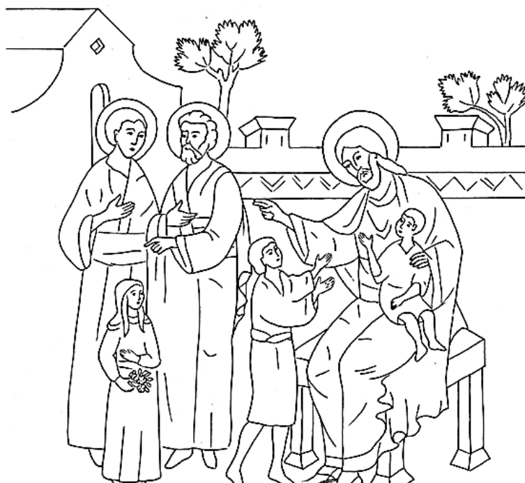
Господ Иисус Христос и децата