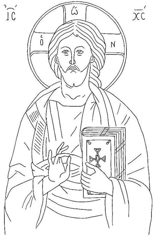
Господ Иисус Христос

В края на 9-ти век в църквите започва да се служи на разбираем език.