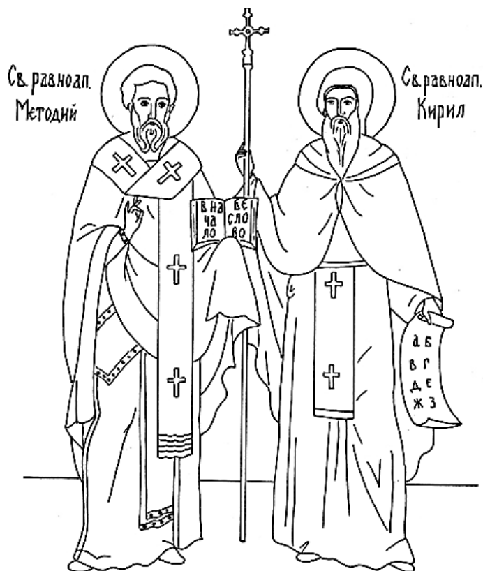
Светите братя Кирил и Методий