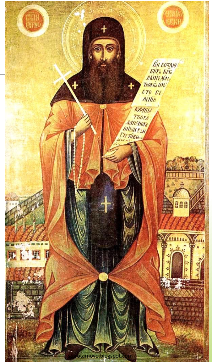
Свети Теодосий Търновски

Свети Теодосий и неговите ученици били монаси в Кефаларския (Килифаревския) манастир. Когато свети Теодосий се отдалечил от манастира на безмълвие, той поставил най-добрия си ученик - Евтимий да се грижи за монашеското братство.